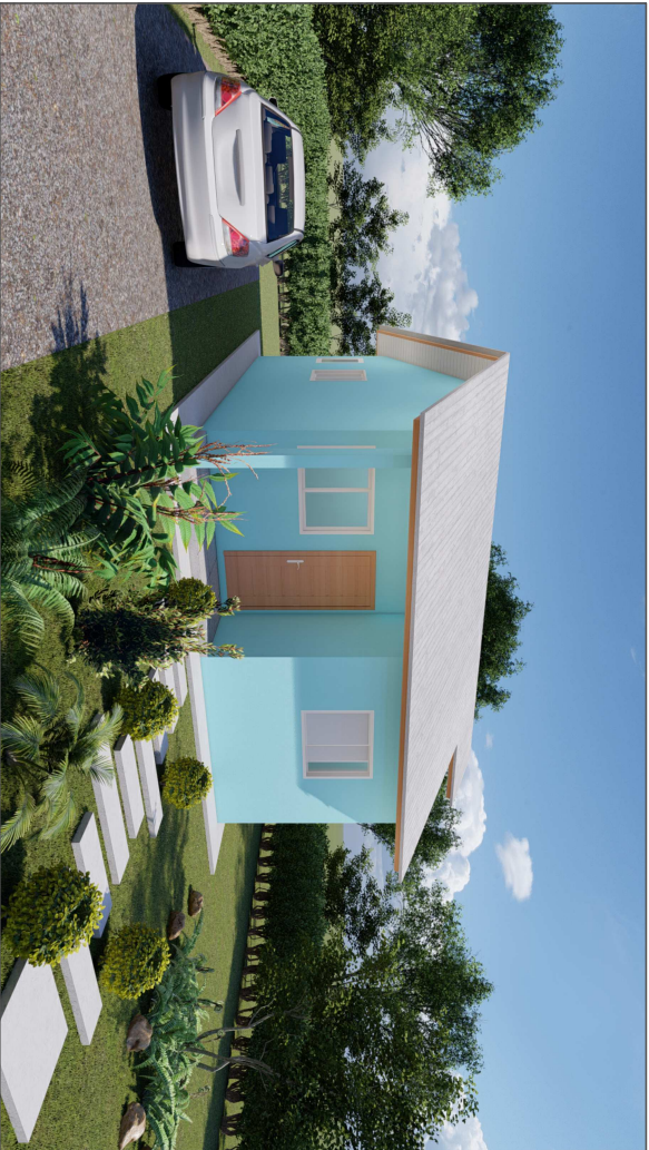
Perspectiva 3D-01 Sem escala